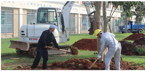
校园中心员工栽种树木

据了解，在一周前，紫荆办公区周边的道路两旁也补种了300棵三角梅，一簇簇红艳艳的花朵甚是养眼，给校园的环境增色不少。