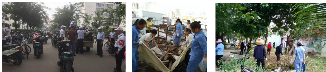
管理人员在整治乱停乱放的车辆